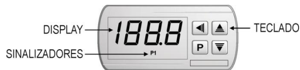
Fig. 01 – Panel frontal del controlador

En el panel frontal del controlador el señalizador P1 enciende cuando la salida de control es enchufada.